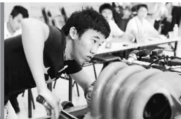
单独招生技能考试。