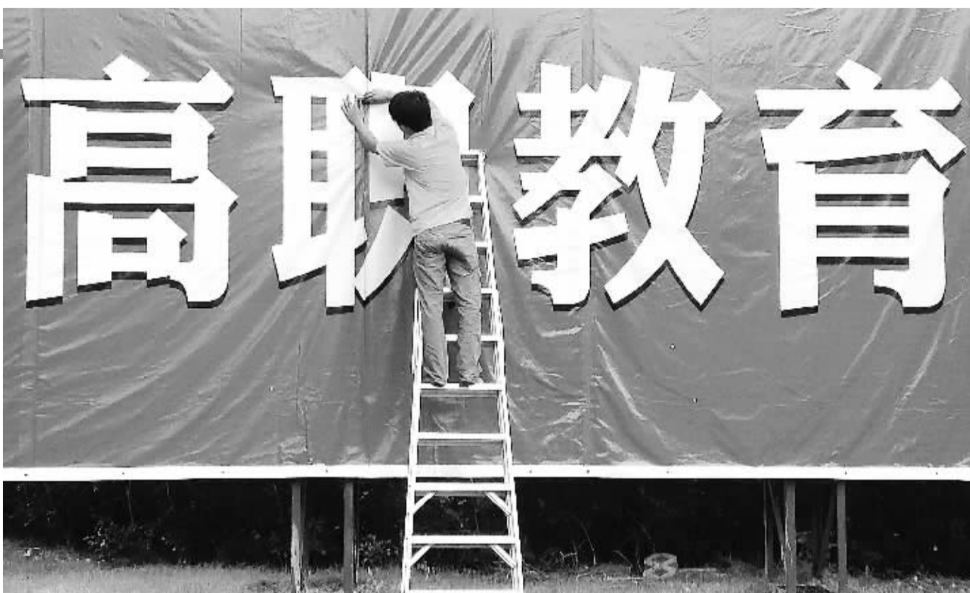
一所高职院校在布置广告宣传牌,迎接新生到校。

生源荒,这类院校心慌。如何破解招生难,事关学校存亡,更事关高等教育的发展方向,破题势在必行。