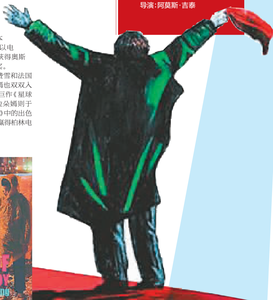
第70届威尼斯国际电影节官方海报