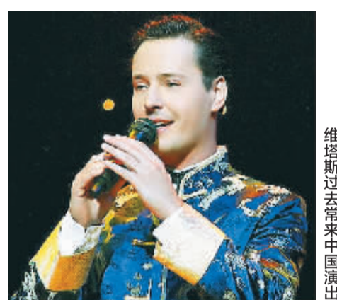
维塔斯袭警被罚款

新华社莫斯科8月26日电(记者刘怡然)俄罗斯莫斯科奥斯坦基诺区法院26日认定俄罗斯著名歌手维塔斯袭警罪名成立,对其处以10万卢布(约合2万元人民币)的罚款。 维塔斯在当天庭审中表示认罪和悔过,其辩护律师向法院提交了俄文艺界人士请求从轻处理维塔斯的请愿书。维塔斯在庭审结束后对媒体表示,法院判决是公正的,他向遇袭警察致歉。 俄侦查委员会发言人马尔金26日说,对维塔斯袭警案的刑事调查完全依法进行,并未受其著名歌手身份的影响。 今年5月10日傍晚,维塔斯驾车行至莫斯科东北部时撞上一辆自行车,造成骑车女子受伤。维塔斯随后用仿真手枪威胁伤者,并辱骂和殴打赶到现场的警察。俄侦查委员会依法以“对当局代表使用暴力”的罪名对维塔斯提起刑事诉讼。该罪量刑最高可重达10年监禁。 现年32岁的维塔斯原名维塔利·格拉乔夫,是俄当红男歌手。2000年,他因一曲高难度的《歌剧2》成名,凭借其极具特色的“海豚音”成为全球瞩目的流行歌手。