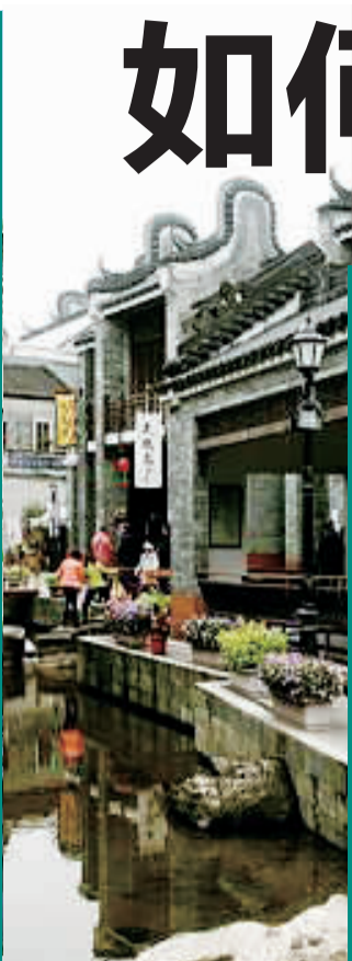
▲ 广州 岭南印象园