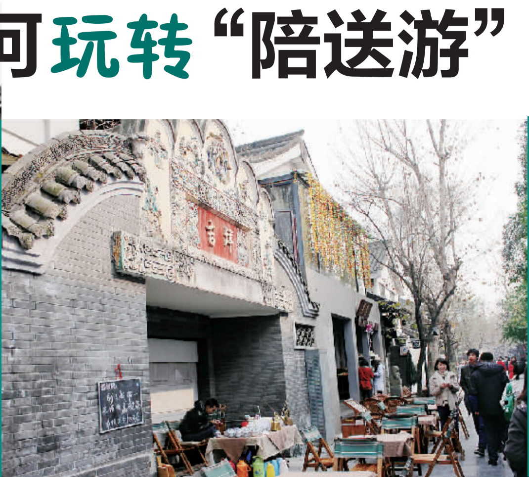
◀ 成都 宽窄巷子