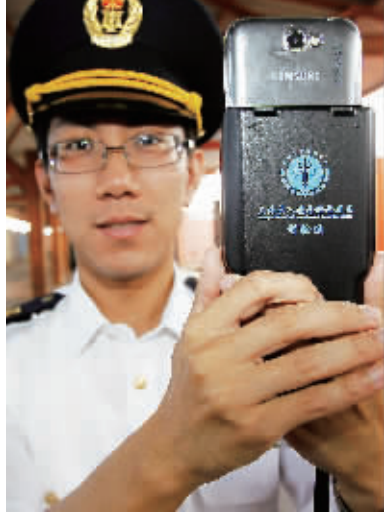
“即查即放”服务自贸区

高虎城表示,商务部将会同国务院有关部门,继续支持上海自贸试验区建设,及时研究解决出现的新情况、新问题。相信试验区能够成为我国推进改革和提高开放水平的“试验田”,发挥好示范带头作用、服务全国的作用,促进各地区共同发展。