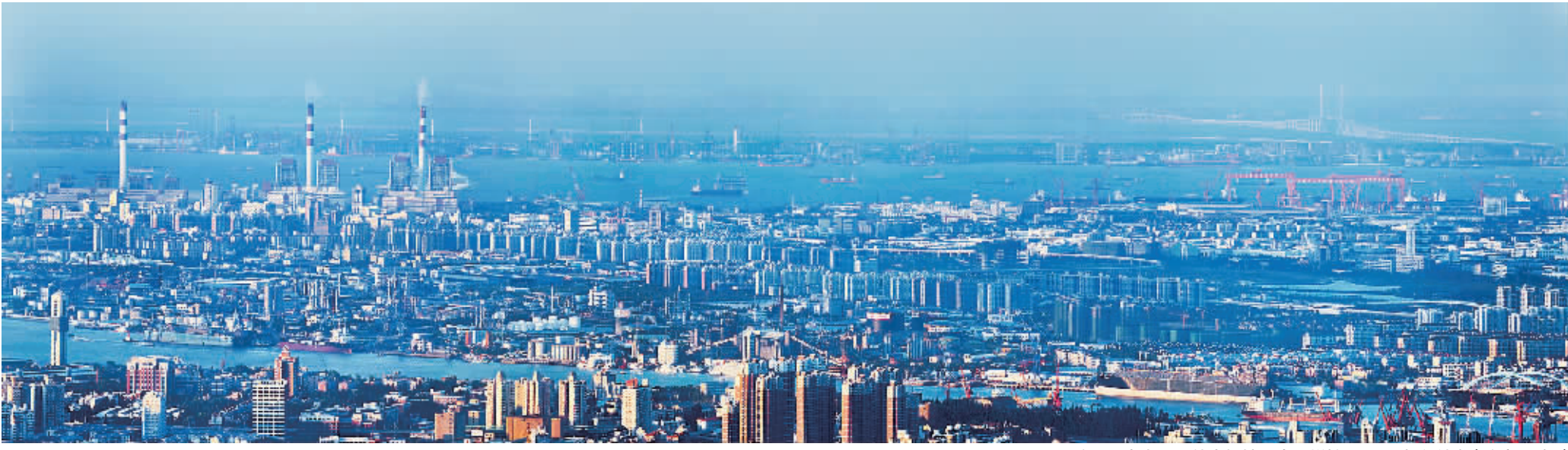
这是上海自贸区外高桥地区全景拼接图。