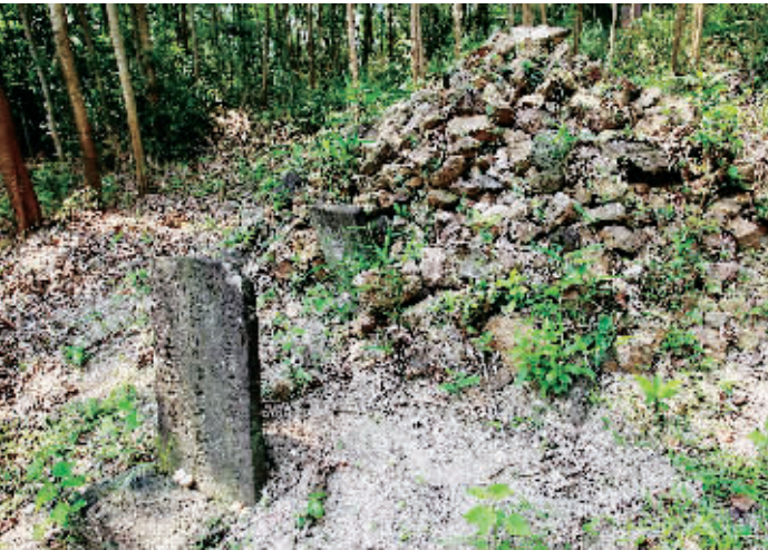
李庆隆墓是座石头坟。

李庆隆作古之后,被葬在定安龙河甜葫芦岭上,其墓现有两碑,是一座颇具传奇色彩的古墓。