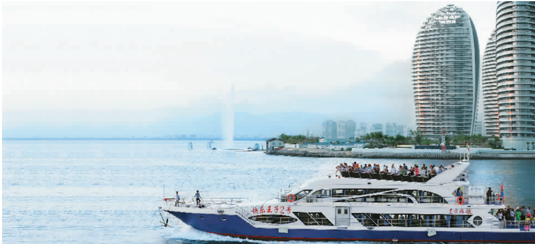
游客乘坐游艇海上游三亚。