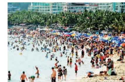
旅游旺季,游客扎堆三亚海滩。

省旅游研究所所长杨哲昆:“大三亚旅游圈”的成立有3个显著作用:优化资源组合,提升旅游产品品位;使琼南各市县受益三亚的旅游市场,同时提升三亚旅游核心地位,形成协调发展格局,避免区域之间的恶性竞争;全面提升琼南旅游的市场竞争力。