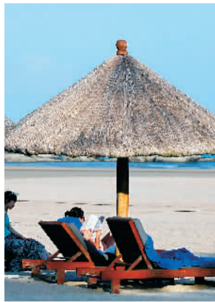
游客在万宁石梅湾沙滩享受美景。

陵水黎族自治县副县长龙丁敏告诉记者,从各市县推介情况看,几乎不约而同都在各自的旅游版图中标明“距离三亚多少公里”、