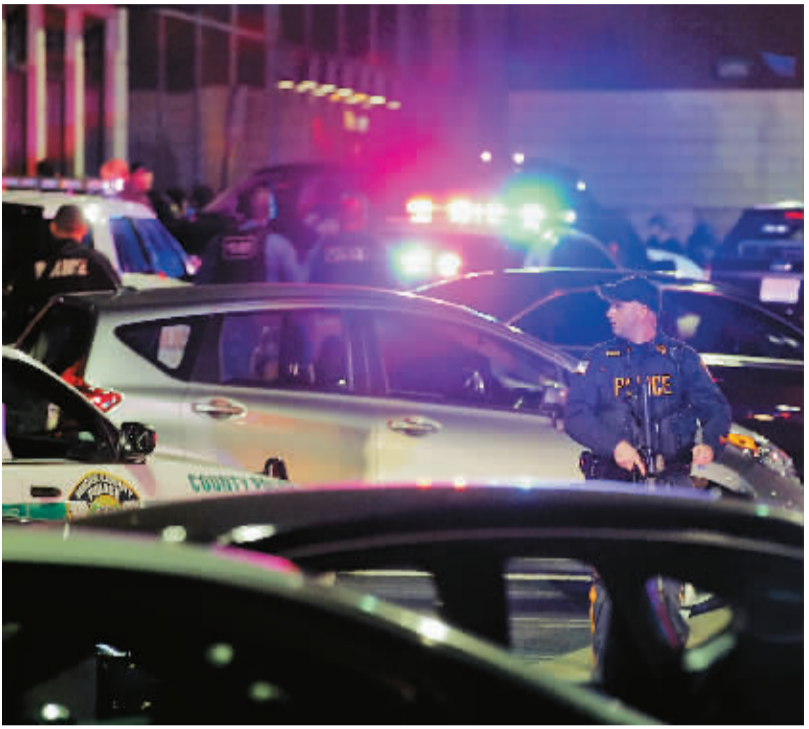
11月4日,在美国新泽西州东北部城市帕拉克斯,警察在发生枪击的购物中心外警戒。

美国新泽西州花园广场购物中心4日晚间发生枪击,警方迅速行动,封锁商场,疏散顾客数千人。截至当夜,警方没有收到人员伤亡的报告,但也没有逮到一名身穿黑色衣服的嫌疑人。