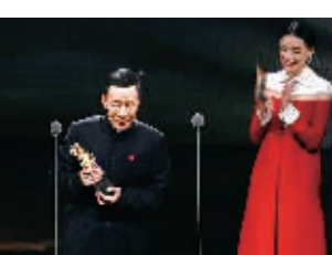
最佳男配角李雪健。