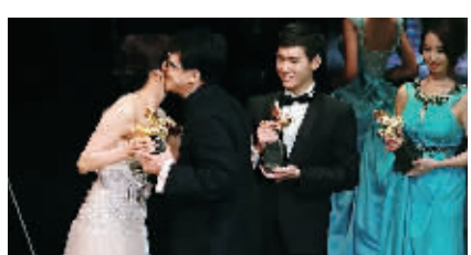
郑裕玲、成龙、何钧、成家班荣获最佳动作设计奖。