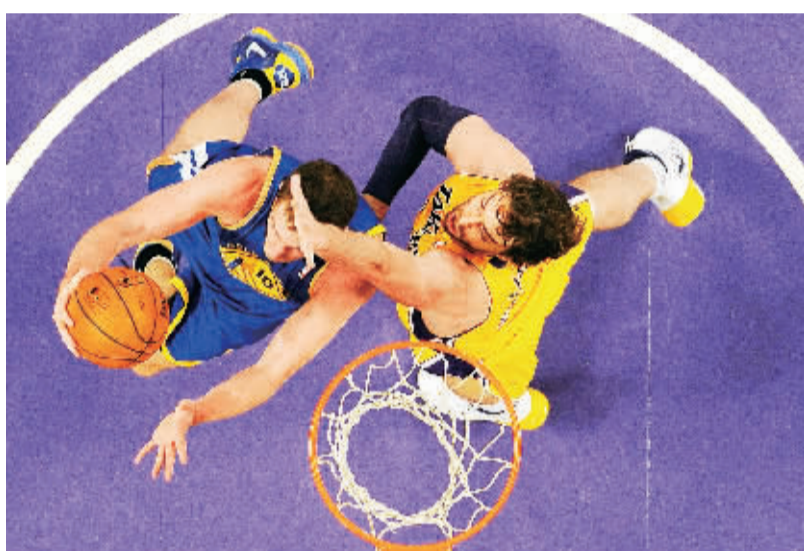
NBA常规赛 湖人胜勇士

11月23日,在NBA常规赛中,湖人队主场以102:95战胜勇士队。图为湖人队球员加索尔(右)防守勇士队球员大卫·李。