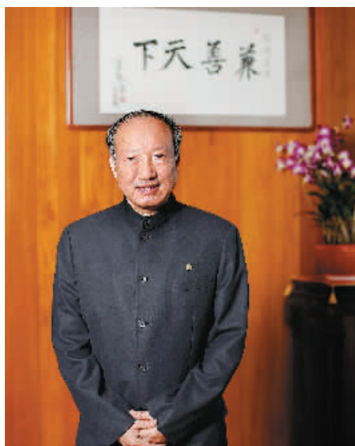
12月5日，在海口市国兴大道的新海航大厦内，海航集团董事局主席陈峰。