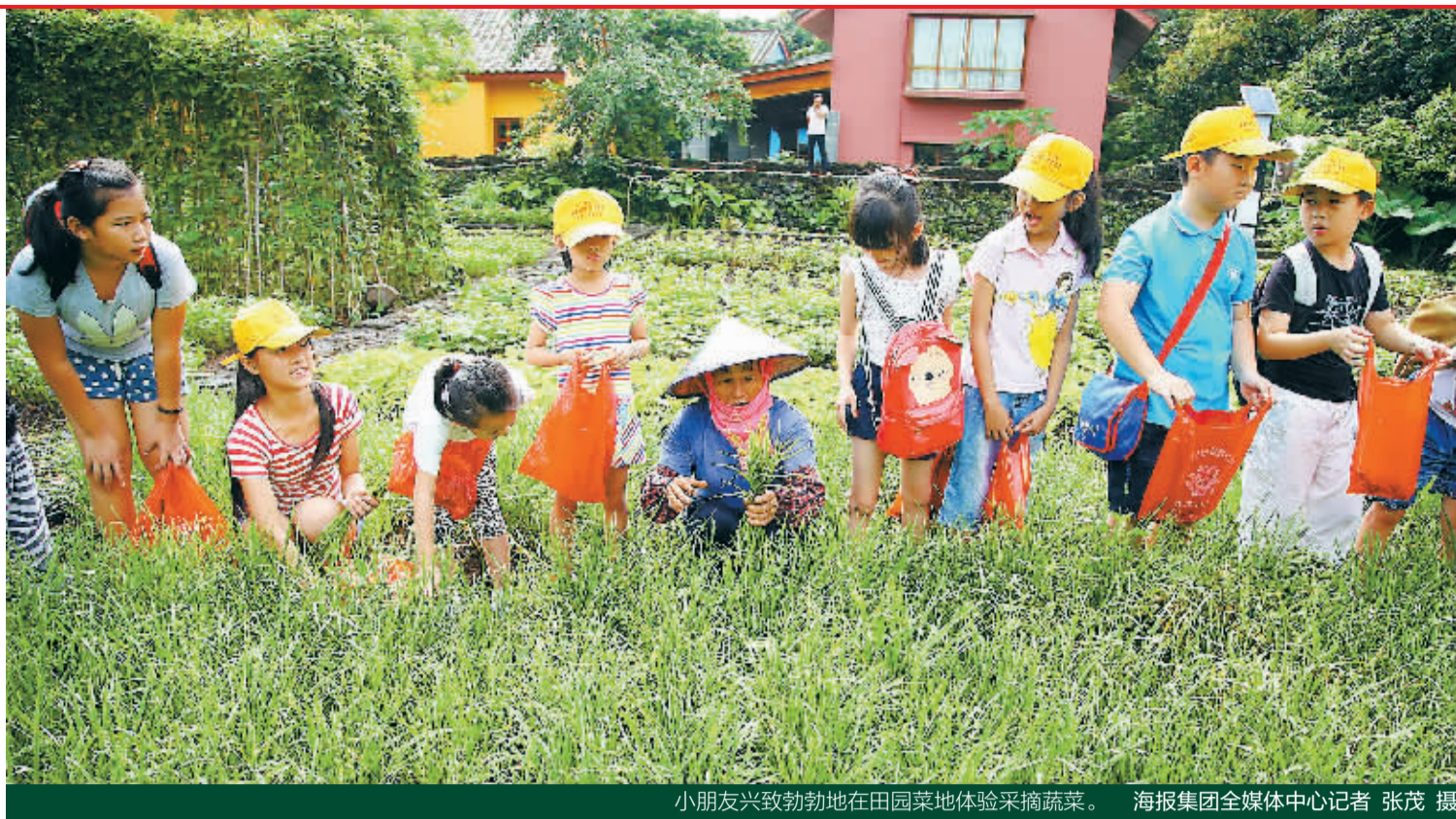
小朋友兴致勃勃地在田园菜地体验采摘蔬菜。