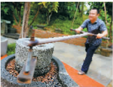
游客体验磨咖啡。

休闲农业真正发展好了，不仅可以增加农民收入，还能有效实现农业的转型升级。如何拉直弯路，走出特色，海南休闲农业也在努力。