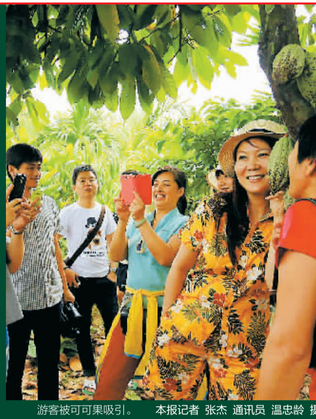
游客被可可果吸引。