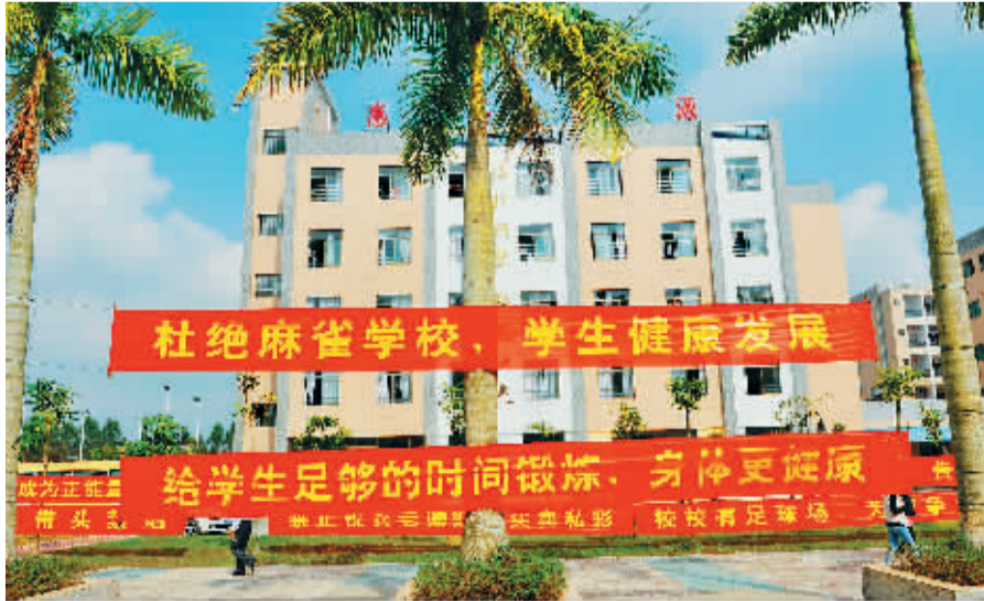
捐书现场悬挂的条幅标语。