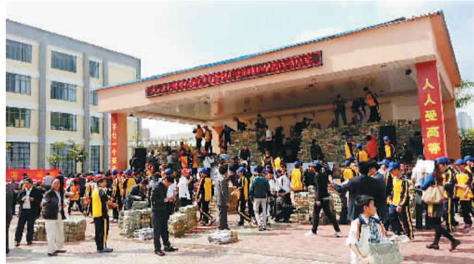
儋州思源高级中学活动现场。