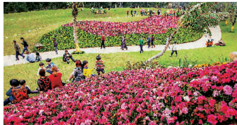
滨海旅游公路的开通, 让月亮湾成为新的旅游热点。

“记者同志你稍等一会儿, 我先去接待个客人。”说话的是龙楼镇顺发海鲜餐厅的老板林顺发。虽然黄金周已经结束, 他的餐厅里客人依旧很多。坐落在淇水湾畔的顺发海鲜餐厅是不折不扣的老字号, 许多游客为了一饱口福往往会专门驱车前来。而在刚刚过去的马年春节, 每天对爆棚的游客还是让林顺发有些吃惊。 “今年的游客比去年多啦! 去年春节时一天最多就五六百人, 今年几乎翻了一倍, 最多的一天餐厅接待了1000多人, 人手都不够用。”林顺发告诉记者, 自己餐厅里的20多张餐桌天天爆满, 有的游客甚至为吃上一顿地道的龙楼三宝甘心等上一个小时。“路通了嘛, 游客都自己开车来, 院子车停得满满的