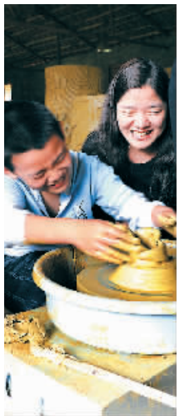
游客在澄迈红坎岭陶艺园制作陶艺。