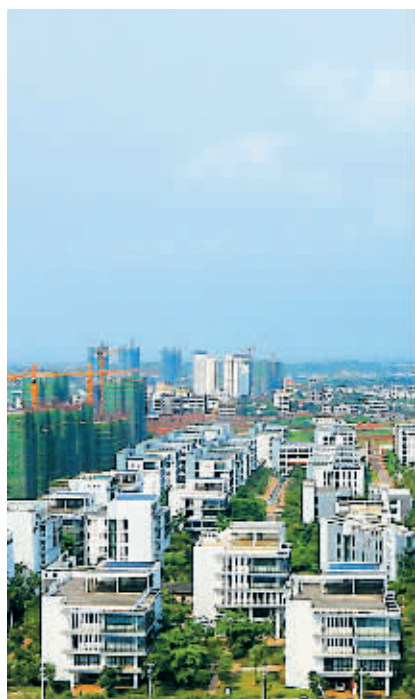
远眺澄迈老城开发区海南生态软件园。

目前,园区与以色列施拉特集团、英飞尼迪集团、英国帝国理工大学帝国创新公司、牛津大学 Isis 创新公司合作,共同建设国际企业孵化器,引进国际人才,整合利用国际创新资源。 (本报金江3月23日电)