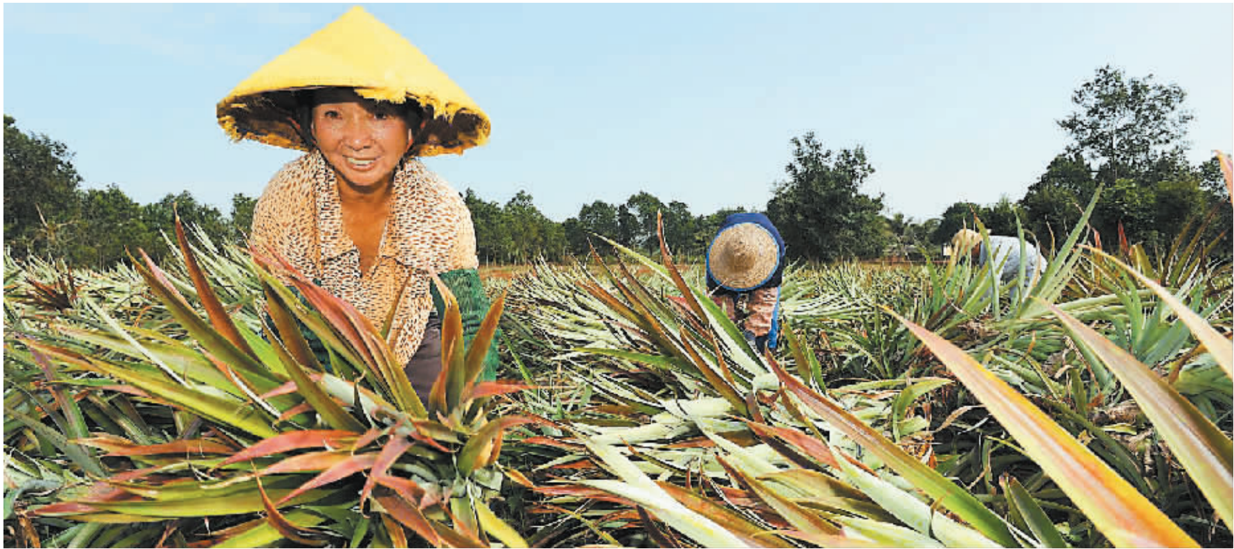
澄迈农庄工人正在忙着给菠萝移苗,这种台湾引进的菠萝一个能够卖20元以上。