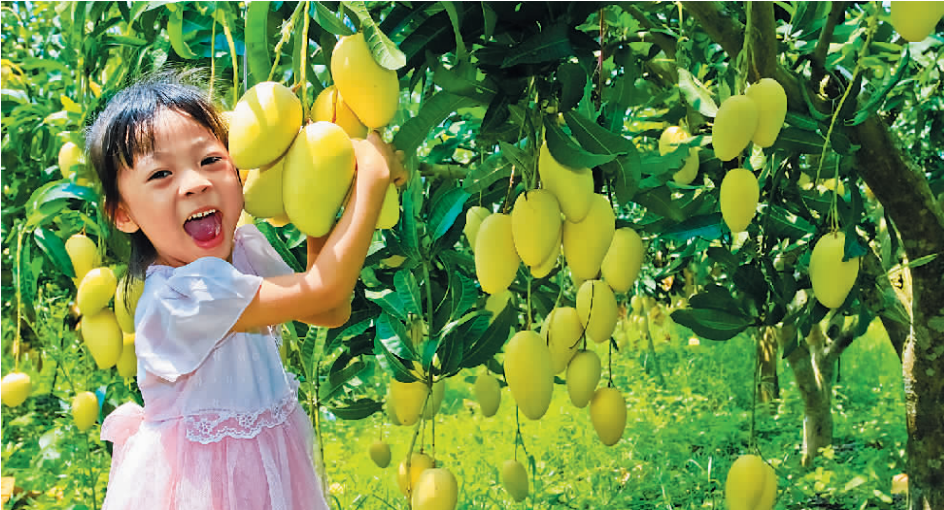
小女孩在昌江芒果园采摘芒果。

活动设计两条主要线路，一条线路是“品芒香－赏黎乡－‘森’呼吸——洗肺之旅”，另一条线路是“品芒香－游古城－行海湾——乐活之旅”，涵盖霸王岭、棋子湾、昌化古城、峻灵王庙等昌江旅游景点。