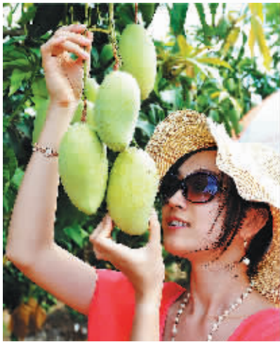
游客在享受采摘乐趣。