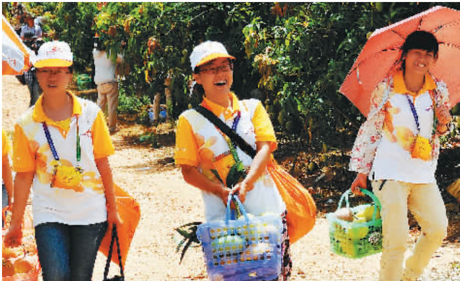
游客采摘芒果满载而归。

芒果是热带水果之王，又名“望果”，即取意“希望之果”。果实椭圆形，果皮呈柠檬黄色，味道甘醇，营养价值很高，维生素A含量高达3.8%，比杏子还要多出1倍。维生素C的含量也超过桔子、草莓。芒果含有糖、蛋白质及钙、磷、铁等营养成分，均为人体所必需。芒果除食用外，具有极大的药用价值，其果皮也可入药。