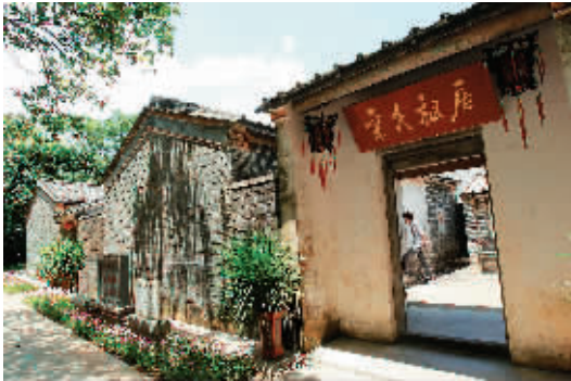
位于文昌市昌洒镇古路园村的宋氏故居。

“在有关宋氏家族三兄弟的报道中,由于宋子良、宋子安的工作经常是宋子文的助手,所以对他们历史上的业绩往往被忽略了。而实际上,他们对国家的贡献自有其独特的地位。”在研究宋氏家族时,海南大学教授唐玲玲对较少有人涉及的宋子良、宋子安两兄弟如此评价。