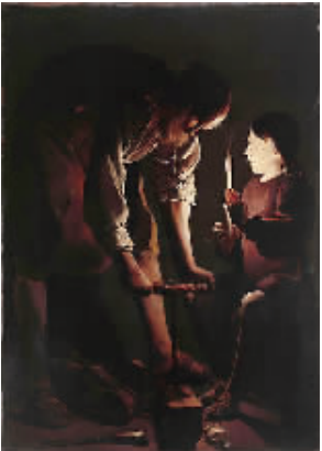
乔治·德·拉·图尔《木匠圣约瑟》约1642年，布面油画，卢浮宫博物馆藏。

十大巨制跌宕起伏，5个世纪的艺术思潮一览无余。中法两国人民的情感再无需言语表达，且看这一幅幅精妙绝伦的画面，都体现出两国人民共同的艺术审美诉求！