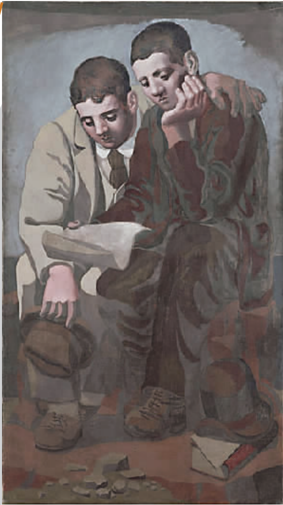
巴勃罗·毕加索《读信》1921年，布面油画，毕加索博物馆藏。