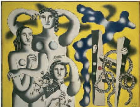
费尔南·莱热《三个肖像的构图》1932年，布面油画，蓬皮杜现代艺术中心藏。