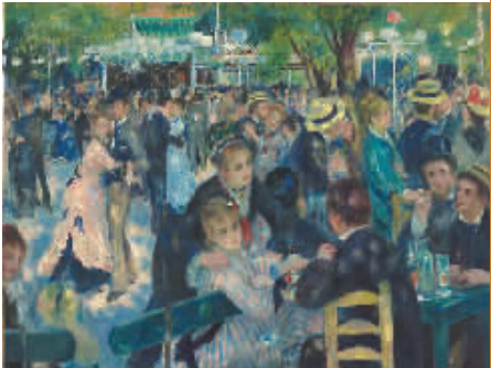
奥古斯特·雷诺阿《煎饼磨坊的舞会》1876年，布面油画，奥赛博物馆藏。