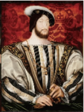
让·克鲁埃《法国国王弗朗索瓦一世像》约1530年，木板油画，卢浮宫博物馆藏。