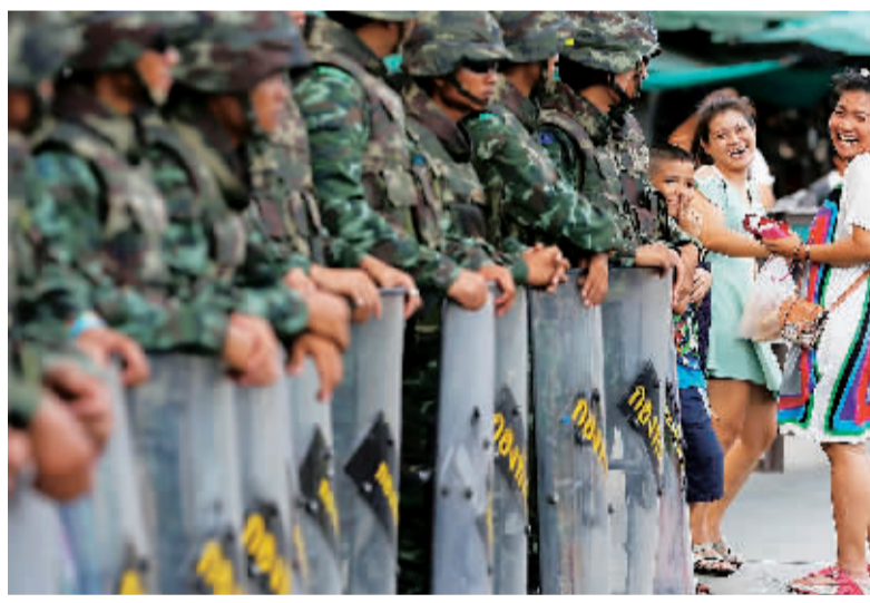
在泰国首都曼谷的胜利纪念碑附近,路人与士兵交谈。

泰国军方30日宣布,将在全国范围建立一批“和解中心”,邀请政见不同的各派人士坐在一起沟通交流,以推动各方达成共识,让泰国重新“回归民主轨道”。 一些分析人士认为,军方这一举措意在施压支持和反对前总理他信·西那瓦的两派民众“和好”,过于理想化。 泰国陆军国内安全行动指挥部发言人班朴·鹏披安上校30日告诉媒体记者,全国维持和平秩序委员会(维和委员会)主席、政变将军巴育·占奥查当天上午与司法机构人员会谈,讨论国内政治和解进程。 班朴宣布,维和委员会将在各府建立“和解中心”,巴育已指派国内安全行动指挥部负责推动国家团结相关事务。 班朴没有说明设立“和解中心”的具体地点和时间,但他强调,这一举措的目的在于“让持不同意见的人坐在一起……这是巴育的模式,其意图是构建和平”。 按照班朴的说法,即便在同一个家庭内,家人之间也可能持有不同政见,“我们必须努力引导人们和谐共处”。 班朴确认,军方将邀请各派政治活动人士前往“和解中心”会商,各派参加人数没有定额。