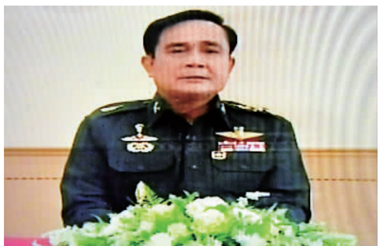
5月30日拍摄的电视画面显示,泰国“全国维持和平秩序委员会”(维和委员会)主席巴育发表电视讲话。

据新华社曼谷5月30日电(记者张春晓 明大军)泰国“全国维持和平秩序委员会”(维和委员会)主席巴育(左图)30日晚表示,过渡政府将于2015财年度开始之前成立,负责执行预算。2015财年始于今年10月。 巴育当晚发表电视讲话,对维和委员会的三步治国方案进行阐述。第一步预计持续两三个月,重点是确保全国范围内的安全与和谐;第二步预计至少持续一年,主要任务包括制定临时宪法、成立立法机构、产生新总理和新内阁、成立改革委员会以推进所有必要的改革任务。最后一步则是举行自由公正的大选。 按照巴育的“路线图”,新一轮选举将在至少14个月至15个月之后才能举行。 巴育说,维和委员会无意为私利长