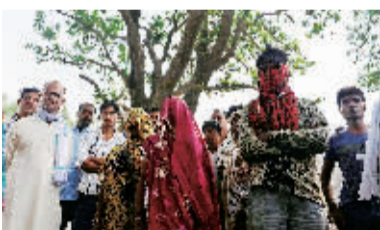
5月31日,在印度北方邦布道恩地区的卡尔塔村,两名遇害少女的母亲和一些村民站在尸体被发现的大树下。