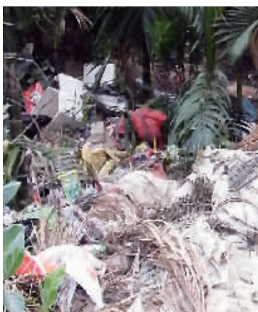
5月26日，通什镇番空村，槟榔园中堆放大量垃圾。

据了解，今年5月15日五指山市政府三届六十七次常务会议审议通过了《通什镇番空村改造工作方案》，将该村作为“城中村”改造，届时该村将实现农村与城市的融合发展。“下一步我们将督促番空村委会建立健全农村卫生管理制度，制定村规民约，引导村民注重环境卫生，加大村民卫生意识教育力度，让村民自觉注重保持环境卫生。”黄育坚告诉记者。