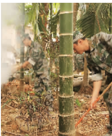
5月29日，通什镇番空村，原先堆积在槟榔园中的垃圾被清理干净。