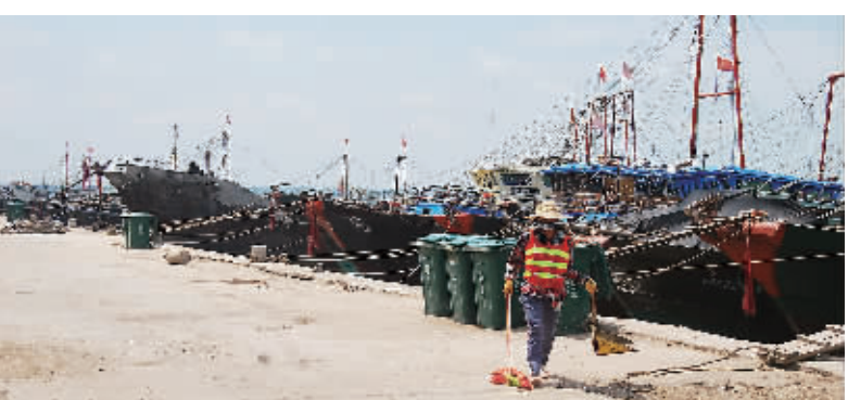
新英码头的保洁工中午依然在工作，不让路面有一点垃圾。

从来没有清理过，日积月累，垃圾堆得像一座小山，包围了1000多米海岸线，整个码头成了个巨大的垃圾场，有些垃圾堆得比码头还要高，渔船根本无法靠到岸边。