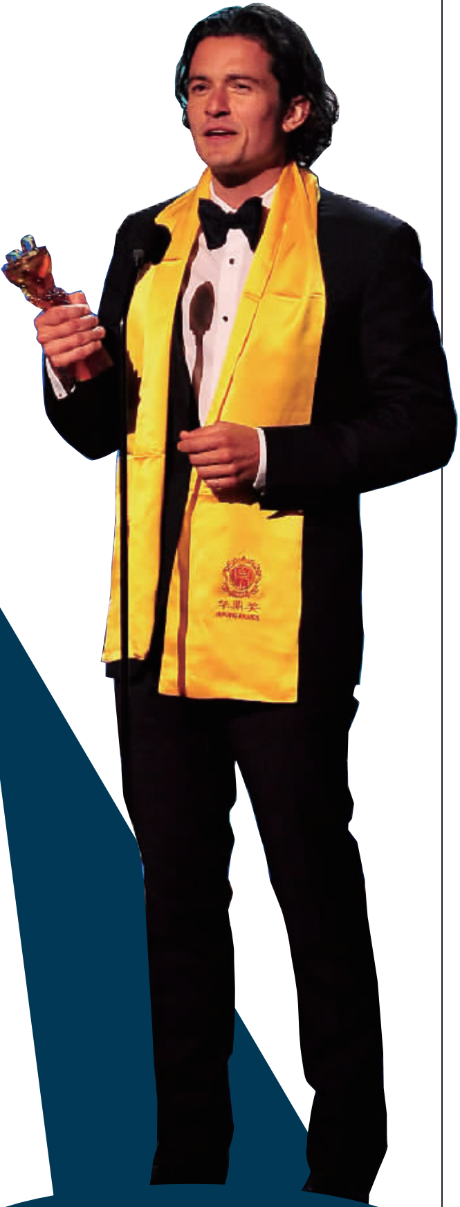
奥兰多·布鲁姆获全球最佳男演员奖