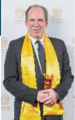
汉斯·齐默获终身成就奖