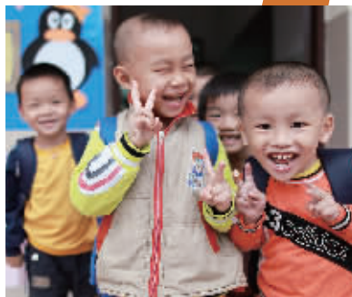
孩子们露出了灿烂的笑容。

由于该幼儿园良好的条件,也吸引到了优良的师资,目前该园所有幼师都是正规专业学校毕业,其中一半有高等教育文凭。“师资力量不比城市差。”她说。