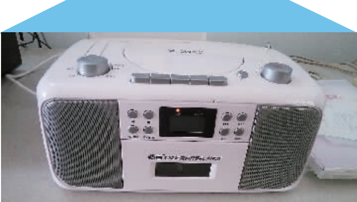
南罗小学一年级学生正在根据智能语音教具拼写生字。