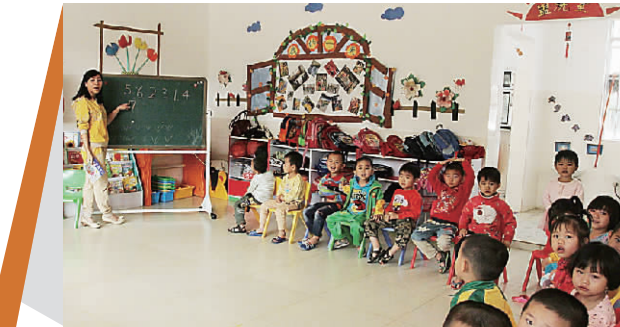
琼中湾岭镇中心幼儿园的教育质量不比省城的幼儿园低。