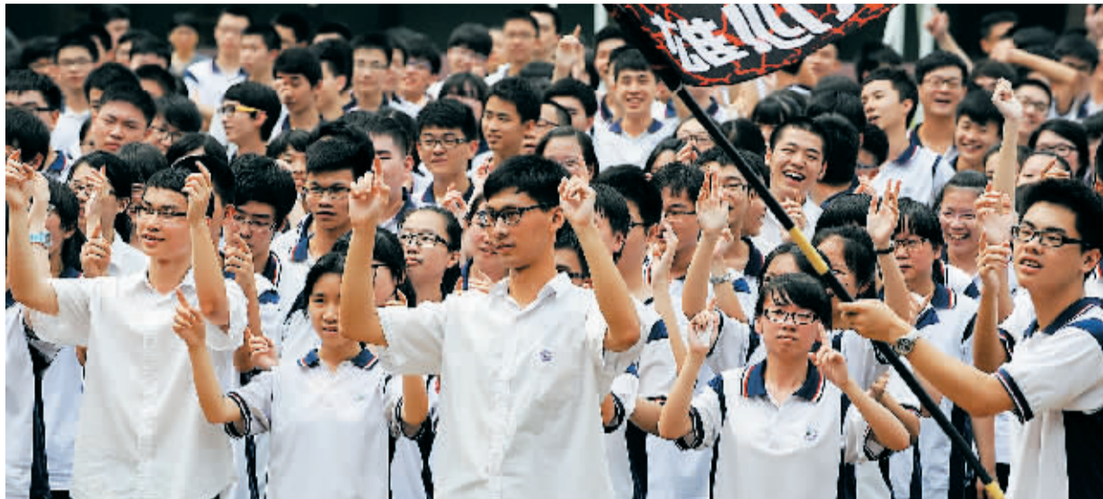
6月4日,即将参加高考的广州市铁一中学高三学生们在鼓乐声中为自己加油。

《2014年高招调查报告》列举的一组数据形成鲜明的“剪刀差”:全国高考报名人数在2008年达到历史最高峰1050万后快速下降,随后两年部分省市曾出现20%的大幅度下降,但近年下降幅度趋缓,今年开始反弹。伴随着报名人数不断下降,录取规模持续增长,2013年全国高考录取率创新高达76%。