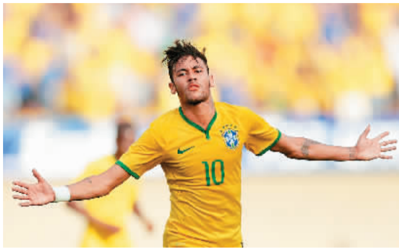
内马尔庆祝进球。

最近半年，C罗左腿髌骨肌腱时好时坏，这影响了他在场上的效率。事实上C罗这是旧伤复发，因为上赛季他的左腿髌骨肌腱就出现过问题。髌骨的肌腱对球员来说是非常重要的，因为它关系到膝部的伸展，无论是传球还是射门都离不开这一肌肉组织的作用，髌骨肌腱的伤病是球员遭遇的最糟糕的伤病之一，“外星人”罗纳尔多在国际米兰踢球时，就曾受这一伤病的困扰。(塞吉)