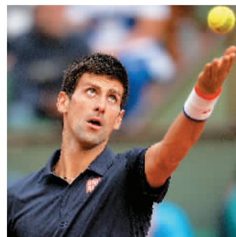
小德晋级法网四强

如果这份提案得到蓝军的首肯，他们将向阿扎尔提供一份为期5年，周薪达15万英镑的长约。倘若阿扎尔完整地履行这份合同，他将从大巴黎收获3900万英镑的薪水，也就是说，法甲豪门已经为拿下阿扎尔准备好了近1亿英镑的高额资金。然而，另据《每日邮报》报道，大巴黎对比利时的开价是6100万英镑，而提供给他的周薪则大大高于15万的数字，达到了令人瞠目结舌的23万磅。如果按照这份合约，巴黎在阿扎尔身上的全部花费将达到1.2亿英镑左右。(小文)