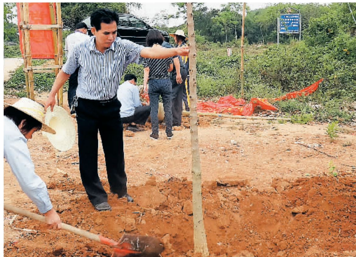
牛开成生前在儋州市雅星镇调打村参加植树节活动。

“远学焦裕禄,近学牛开成”,作为一名来自最基层的乡镇干部,牛开成同志的事迹引起我省干部群众强烈的反响和共鸣。他殉职后,先后被追授“海南省优秀共产党员”和“全国纪检监察系统先进工作者”等荣誉称号,成为全省党员干部,以及全国纪检监察系统干部学习的楷模。