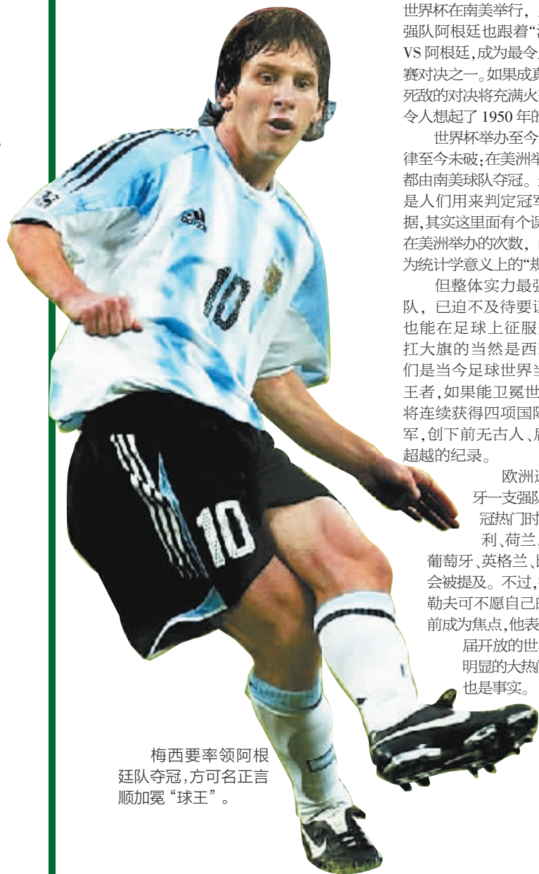
梅西要率领阿根廷队夺冠,方可名正言顺加冕“球王”。