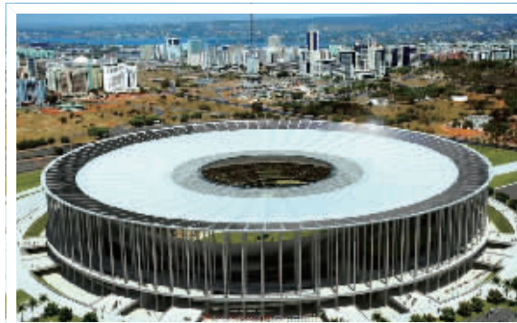
圣保罗竞技场 (举办开幕式和一场半决赛)

能容纳52048人，将举办6场比赛。新水源竞技场于1951年1月28日开放，多次举办巴伊亚和维多利亚体育俱乐部间的德比。2007年11月关闭三年后拆除。新球场在旧址上修建，是个有全景餐厅、足球博物馆、停车场、商店、酒店和音乐厅的综合设施。新水源竞技场将举办四场小组赛（其中三支球队是种子球队）、1场16强淘汰赛、1场四分之一决赛。