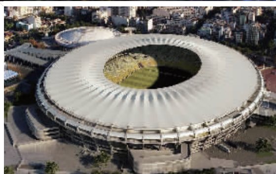
国家体育场 (举办季军争夺战)

巴西世界杯将由12座城市的12座球场共同参与承办，开幕式在圣保罗的圣保罗竞技场，季军争夺战在首都巴西利亚的国家体育场，决赛在著名的里约热内卢的马拉卡纳体育场进行。此外参与举办的还有萨尔瓦多的新水源竞技场、阿雷格里港的贝拉里奥体育场、福塔莱萨的卡斯特朗体育场、库亚巴的潘塔纳尔竞技场、马瑙斯的亚马逊竞技场、贝洛奥里藏特的米内朗体育场、累西腓的伯南布哥竞技场、纳塔尔的沙丘体育场。