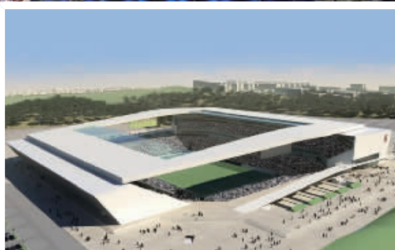
萨尔瓦多新水源竞技场 (举办6场比赛)

巴西很少有能与首都巴西利亚相比的城市，壮观的国家体育场是2014巴西世界杯中第二大的球场，能容纳68009名观众。国家体育场有新的外观，金属顶棚和看台，以及更低的场地，使得每个座位都能有无障碍的视角。建立碳平衡，资源回收都通过公共交通设施，这个环保建设项目巩固了巴西的世界可持续城市规划地位，为当地其他经济领域创造了良好的示范。