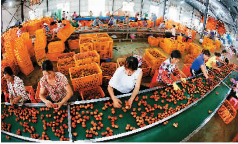
工人正在车间挑选无核荔枝果。

今年，澄迈种植无核荔枝近 8000 亩，预计总产量达 638 万斤，总产值达 25 亿元。无核荔枝的高产高销不仅带动了当地农民增收，也带动了其他市县及广东、广西、福建等地无核荔枝的种植，成为全省乃至中南地区农民的摇钱树。