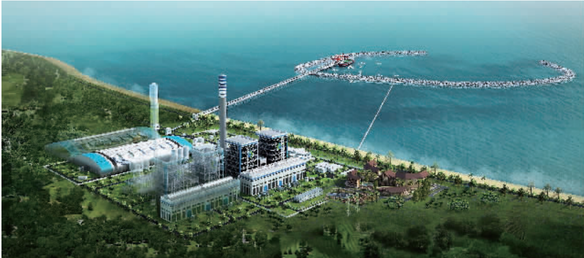
西南部电厂项目效果图。