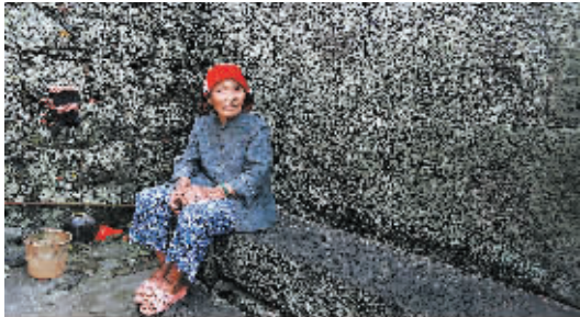
古村中的长寿老人。

头联读一遍,谁也没有举起相机拍摄的冲动。村里人解释,为了汽车能开进去,所以扩建了大门改变了原貌。