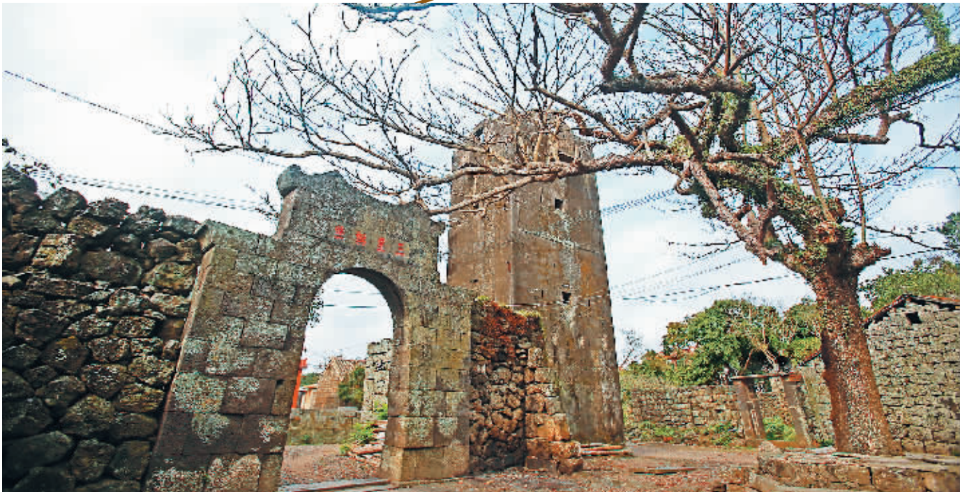
海口市石山镇三卿村,图为村口百年豪贤门与碉楼。

穿过海口火山口地质公园往石山镇,地势一路下行,如同寻着火山熔岩奔流的轨迹,石山镇道堂村委会三卿村便落在了底部。