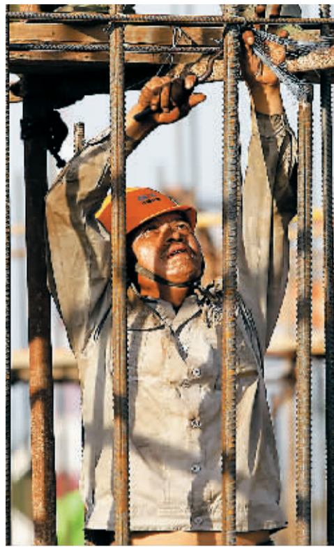
工人在高空捆扎钢筋。