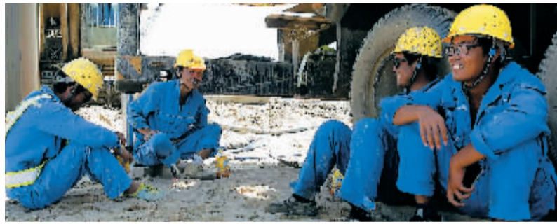
烈日下，工人在工程机械旁小憩。

巨大的人力物力投入，有力地推进了工程施工进度。从3月中旬全厂地基处理工作开始施工，目前，累计完成桩基数量1000根，已完成烟道、#1锅炉桩基、汽机房和汽轮机桩基侧煤仓和磨煤机桩基施工。6月4日，主厂房开挖，具备基础施工条件，预计7月浇筑混凝土，项目正式开工。