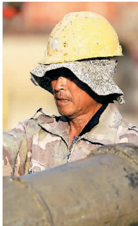
工人在冲洗混凝土导管。