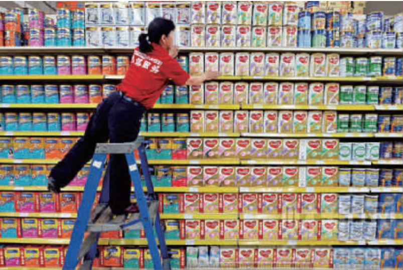
超市里的乳粉“墙”(资料图片)。

身着军装、自称中将,持有“联合国维和部队总司令部特别通行证”……5月17日,四川自贡警方抓获了一名冒充高官、以“修航母码头”的大项目寻找合作伙伴、企图骗取3000万元巨额保证金的犯罪嫌疑入。由此,一个荒诞的山寨组织也再次浮出水面。