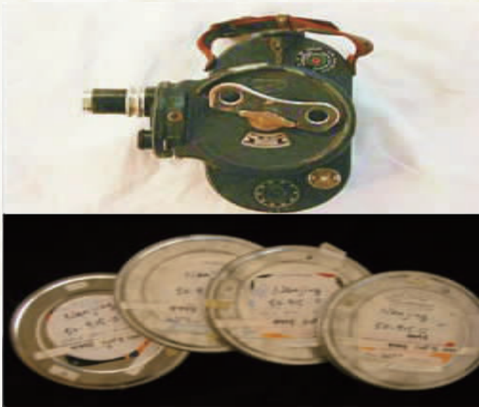
↑美国牧师约翰·马吉用16毫米摄影机拍下的南京大屠杀唯一的第三方影像资料。