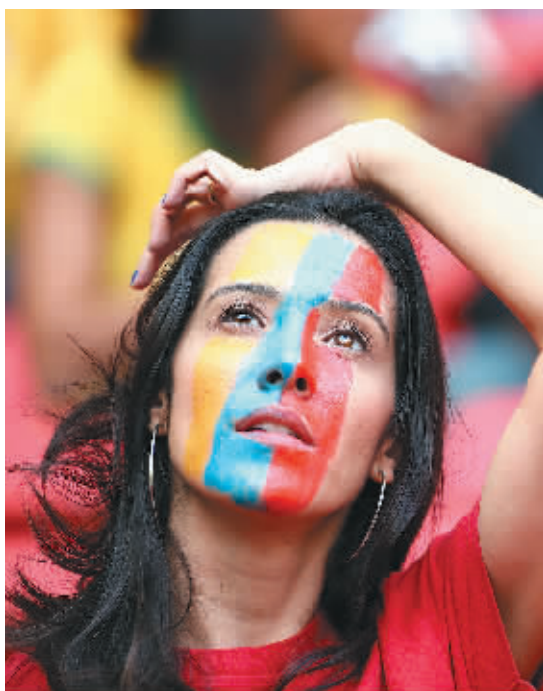
比赛还没开始,一美女球迷似乎有点不耐烦了。