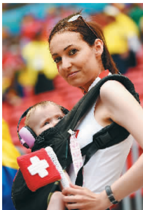
瑞士美女球迷带着孩子等待比赛开始。