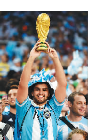
6月15日,一名阿根廷球迷在阿根廷对阵波黑的比赛开赛前举起“大力神杯”模型。

糖糖:厄瓜多尔终场前一次绝佳的机会没把握,被人一个反击干掉,真是天堂到地狱一念之差啊。