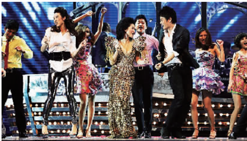
音乐剧《爱上邓丽君》剧照