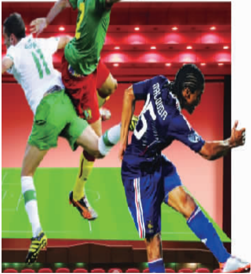
看不到3D世界杯成为球迷的遗憾

点评:从世界杯开赛时间来看,跟电影的放映时间并不冲突,在完成“主业”之余,让影院搞点“副业”,一来可以满足球迷看大屏3D足球的需求,另一方面也能增加影院收入,何乐而不为?侵权说只是有关部门“懒政”的借口,现在进口电影的收益分配机制已经很成熟,嫁接到世界杯转播上来也并非难事。文化产业的发展需要好的创意,但是更需要有关部门开放的心态和政策的支持。