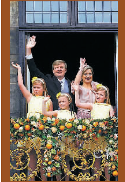
2013年4月继位的荷兰新国王威廉·亚历山大和王后及公主们。