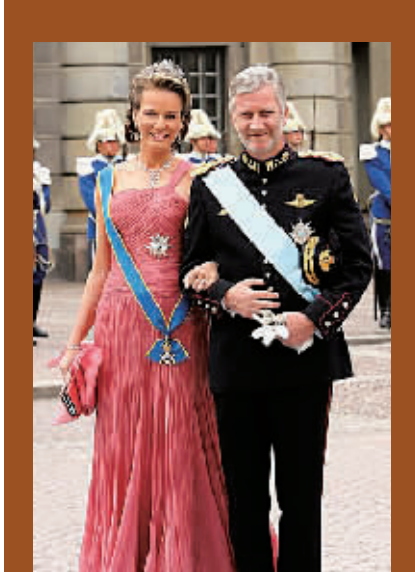
2013年7月继位的比利时国王菲利普和王后。