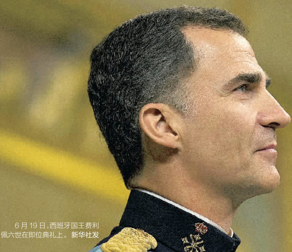
6月19日,西班牙国王费利佩六世在即位典礼上。