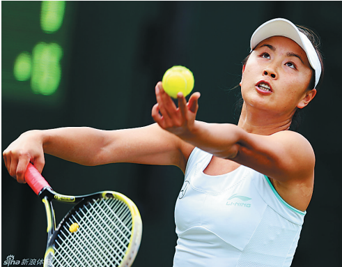
彭帅在温网比赛中发球。 小新发

本报讯 北京时间6月23日晚,2014年温布尔登网球锦标赛开战。在第12号球场进行的首场比赛中,中国金花彭帅经过三盘大战,以6:4/3:6/6:4击败本土姑娘孔塔,打响了中国金花在本届温网的头炮。 彭帅在今年澳网、法网均首轮出局的情况下,终于取得本赛季的大满贯首胜。彭帅下轮将遭遇基里连科,后者以6:2/7:6(6)爆冷战胜美国新星斯蒂文斯。 尽管孔塔世界排名只有109位,不过这位刚刚年满23岁的本土球员已经第四次征战温网正赛,有着相当丰富的经验。过去三周均在参加草地赛的孔塔,显然比在伊斯特本首战就被淘汰的彭帅更加适应草地。两人去年曾在广州有过一次交手,当时孔塔直落两盘轻松取胜。显然面对如此具备冲击力的老将,彭帅陷入了苦战。 双方各胜一盘后进入决胜盘,彭帅在第三局极具侵略性再次取得破发,就带着2:1的领先。此后经验丰富的彭帅没有给对手机会,彭帅最终以6:4取胜,拿下本赛季的大满贯首胜。(小新)