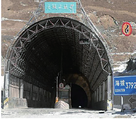
世界最长高海拔高铁隧道大坂山隧道。

据新华社电 由中国铁建十八局集团三公司承建的世界最长高海拔高铁隧道——兰新铁路客运专线大坂山隧道无砟轨道，日前全部完成施工任务，为兰新铁路客专按时通车奠定基础。 大坂山隧道全长15918米，为兰新铁路客专第一特长隧道，位于青海省大通回族自治县和门源回族自治县境内的大坂山中高山区，穿越大坂山主峰，是世界最长的高原高速铁路隧道。 该隧道地处高海拔地区，平均海拔3100米，高寒缺氧，最低气温零下34摄氏度，自然环境恶劣。隧道最大埋深达1085米，地质复杂，石质破碎，多为砂岩、碳质板岩，并且有大涌水、岩爆和瓦斯，属于一级高风险铁路隧道，也是全线控制性重点工程。