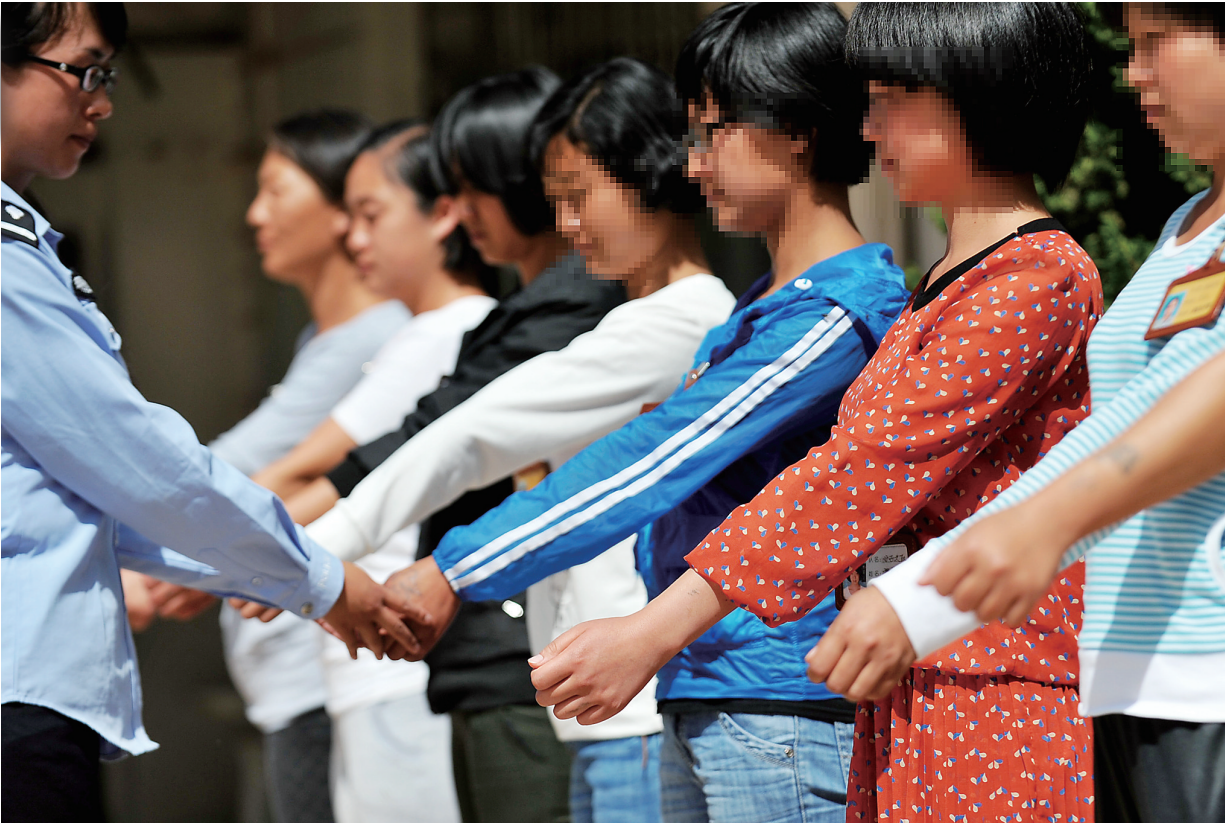
云南省大理戒毒所里的年轻女孩。 大理戒毒所共有1600多名戒毒学员，实行开放式管理模式，不仅开设了养殖、绘画、雕刻、电工、缝纫等10余个职业技能培训项目，还专门成立了艺术团，让学员们在表演中重塑自信，起到了良好的示范作用。

浙江、重庆。特别是广东，毒品犯罪数量在2007年到2013年始终居于全国首位。云南、广西、重庆现在毒品犯罪数量高发，东北地区的辽宁省受各种因素的影响，毒品犯罪案件数量正在快速增长。 据统计，2014年1至5月，全国法院新收毒品犯罪案件43180件，同比增长30.19%；审结37186件，同比增长31.15%；判决发生法律效力犯罪分子39762人，同比增长27.38%，其中判处5年以上有期徒刑、无期徒刑至死刑的9168人，同比增长23.21%。