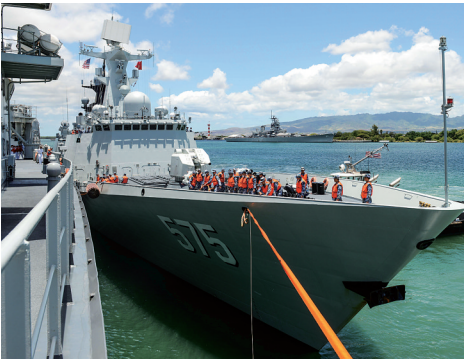
当地时间24日9时(北京时间25日3时),参加“环太平洋-2014”演习的中国海军导弹驱逐舰海口舰、导弹护卫舰岳阳舰、综合补给舰千岛湖舰与和平方舟医院舰,顺利抵达美国夏威夷珍珠港基地。