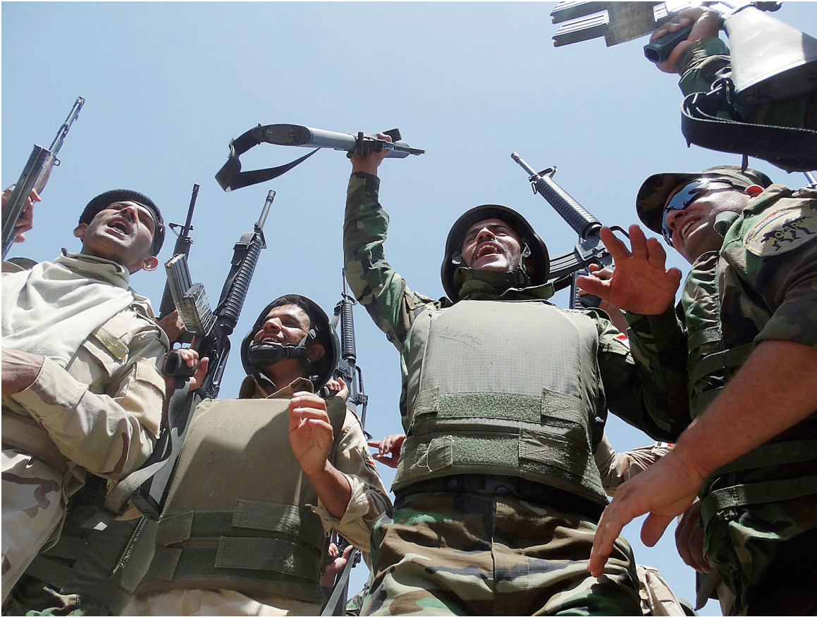
伊拉克军队抵达安巴尔省的拉马迪后高举武器。他们将支援当地民兵组织“觉醒委员会”,与包括“伊拉克和黎凡特伊斯兰国”武装组织在内的反政府武装作战。

在西部安巴尔省,安全部队对费卢杰以西50公里地区的武装分子进行了打击,共打死24名武装分子,摧毁6辆军车。