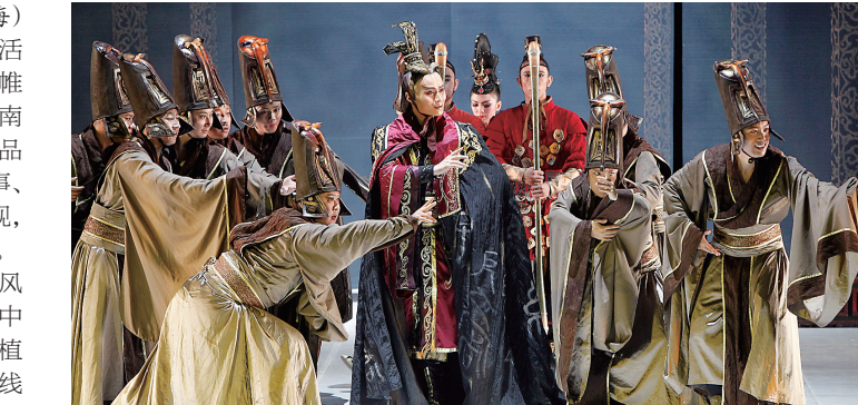
《水月洛神》海口演出剧照

本报海口6月25日讯（记者戎海）由省文体厅主办的精品剧目惠民演出活动,今晚在省歌舞剧院拉开首场演出帷幕。来自郑州歌舞剧院的演员们,为海南观众献上了多次荣获国家级大奖的精品舞剧《水月洛神》,凄美动人的爱情故事、浪漫唯美的舞蹈、美轮美奂的舞台呈现,让海南观众尽享视听盛宴,直呼“超值”。 《水月洛神》是郑州歌舞剧院继《风中少林》之后精心打造的又一部展示中原文化的大型舞剧。该剧以曹丕、曹植二人的兄弟相争和甄姬的命运遭遇为线索,不仅讲述了一个凄美无比、感人至深的爱情故事,也因深邃的命运主题而震撼人心。曹丕、曹植的诗词,汉砖雕、汉代建鼓等道具及汉代服饰的展现,也使舞剧充满浓郁的中国文化气息。 《水月洛神》先后获得第八届“中国舞蹈‘荷花奖’”舞剧、舞蹈诗作品金奖,中宣部第十二届精神文明建设“五个一