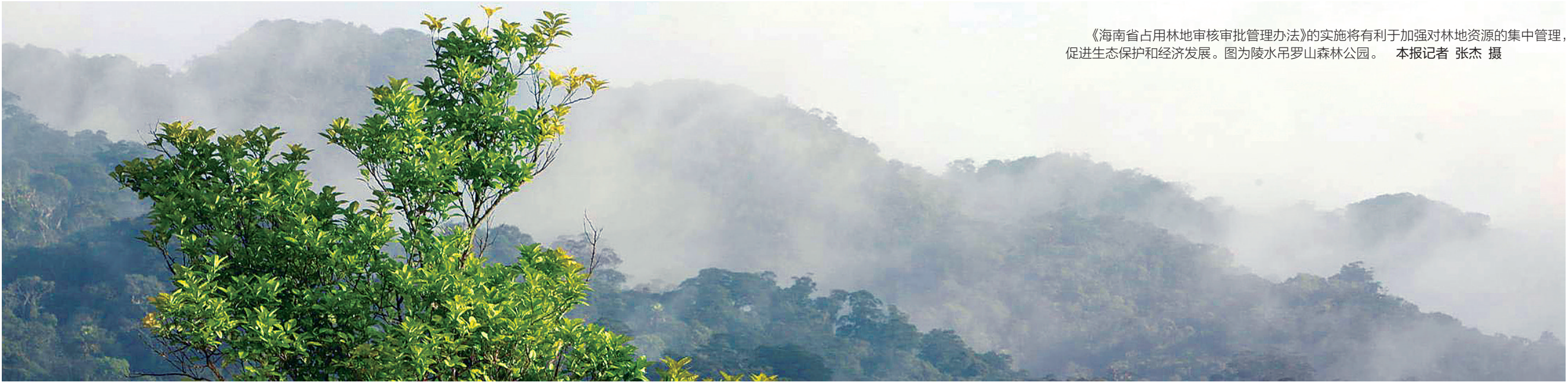
《海南省占用林地审核审批管理办法》的实施将有利于加强对林地资源的集中管理，促进生态保护和经济发展。图为陵水吊罗山森林公园。