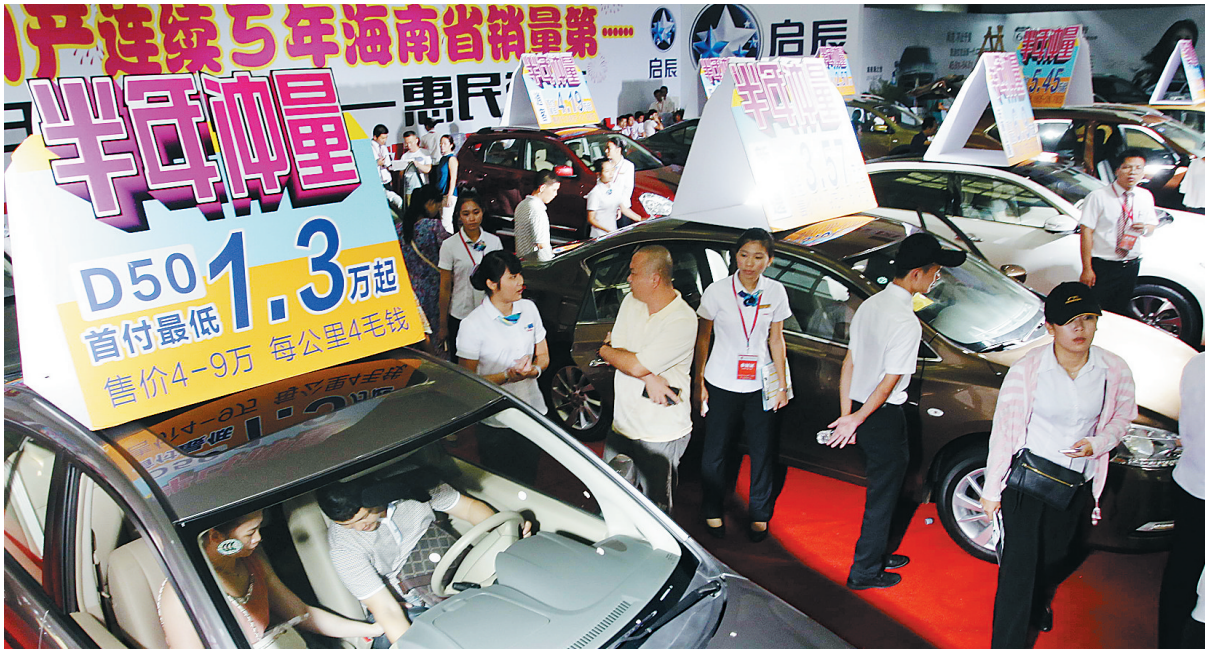
6月27日,由海南日报报业集团主办的惠民车展现场人气火爆。

据了解,海南日报报业集团2014金秋车展将于9月4-7日在海南国际会展中心举行,该展会提前3个月举办惠民活动,即举办此次惠民车展。从2007年开始,每年一届,定期在9月上旬举办的海报集团金秋车展,已成为“海南最能卖车的展会”。