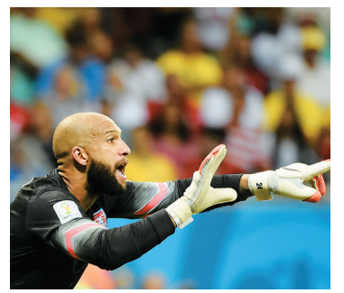
北京时间7月2日，美国队守门员霍华德在比赛中指挥防守。

比利时和美国队的世界杯八分之一决赛90分钟常规比赛内，美国队门将霍华德获得的头衔只有一个：“门神”。正是他一双一夫当关万夫莫开的“魔手”，让克林斯曼的球队熬到了加时赛。