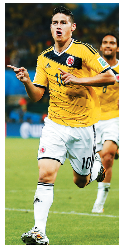
“J罗”罗德里格斯带球。