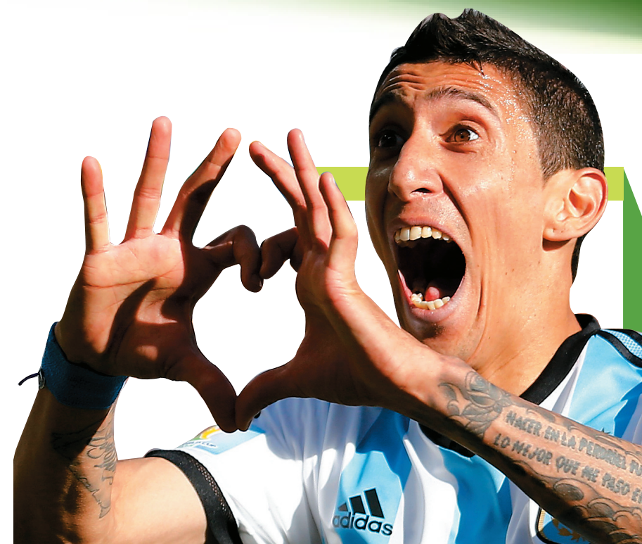
阿根廷队在加时赛快结束时才打进致胜进球。图为迪马利亚进球后庆祝。

有巴西队的“肥罗”、小罗。如今J罗强势崛起，从世界杯前最被看好的新秀之一到4场比赛的持续绽放，J罗在哥伦比亚队的地位正逐渐超越前10号球员巴尔德拉马。四分之一决赛对阵巴西队，将是对J罗的关键考验之战。