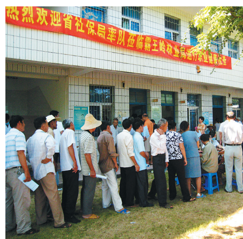
“流动体检”到霸王岭林业局为职工进行健康体检。