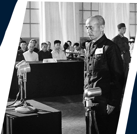
日本战犯长岛勤在法庭上。