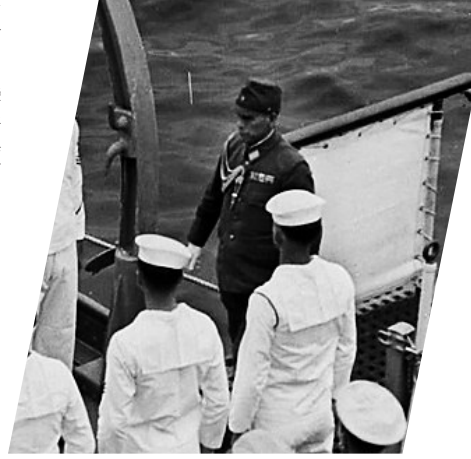
美国水兵注视着日本将军梅津美治郎(左)及unident登上密苏里号战舰正式签署投降。