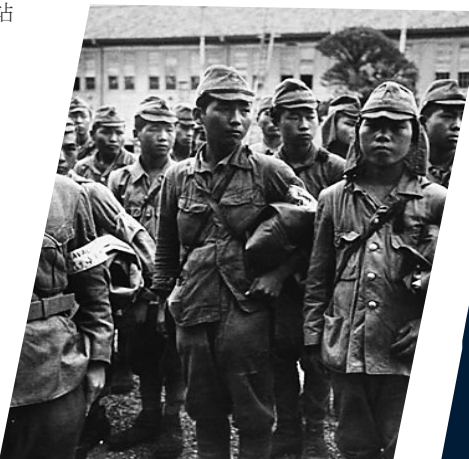
日本海军人员闷闷不乐地听着他们的指挥官说明情况后,栗原海军基地投降美国军队。