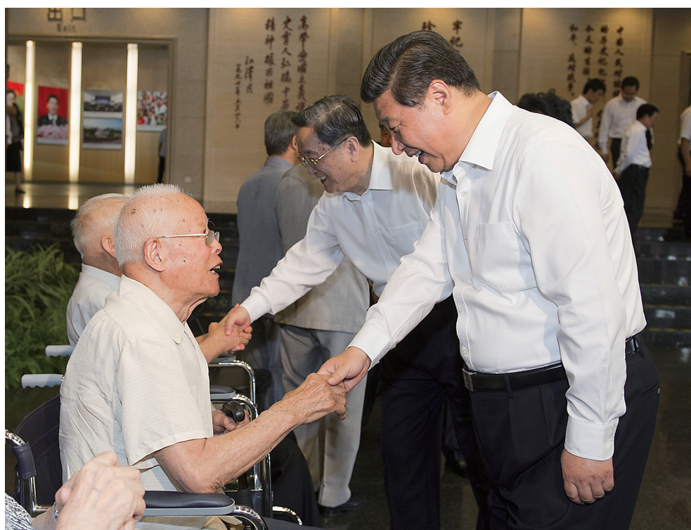
7月7日,首都各界在中国人民抗日战争纪念馆隆重集会,纪念全民族抗战爆发77周年。中共中央总书记、国家主席、中央军委主席习近平出席纪念仪式并发表重要讲话。这是参观结束后,习近平等亲切看望参加仪式的抗战老战士和老同志代表。新华社记者 黄敬文 摄

方面来作战,他们可以马上打下澳洲,打下印度……英国首相丘吉尔也曾说:如果日本进军西印度洋,必然会导致我方在中东的全部阵地崩溃,而能防止上述局势出现的只有中国。苏联著名将领崔可夫元帅在其回忆录中说:“在我们最艰苦的战争年代,日本没有进攻苏联,却把中国淹没在血泊中。稍微尊重客观事实的人,都不能不考虑到这一明显而又无可争辩的事实。” “中国的贡献不止于此。”贺新城说,“那个时期,中国处于半封建半殖民地状态,东亚国家大都是殖民地国家。在抗战中,中国提出了非殖民化的主张,这是一个仗义之言。”这不只是改变了中国的命运,也改变了亚太地区人民的命运。二战后,这些国家纷纷走上了为争取独立而斗争的道路,并最终摆脱了殖民统治。“中国是希望所有国家都摆脱殖民统治,而日本帝国主义则希望将亚太地区西方殖民地都变为自己的殖民地。这一点与中国形成鲜明对照。”贺新城说。