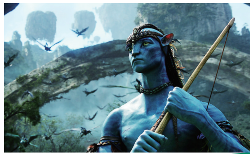
《变4》票房赢了《阿凡达》