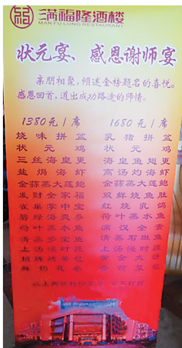
谢师宴渐受冷落。