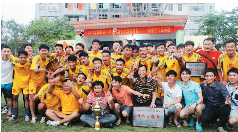
琼海嘉积二中足球队夺冠后的合影。