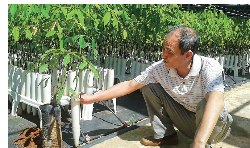
图为小筒育苗器中培育出来的橡胶树苗。

本报那大7月9日电(记者范南虹 通讯员林红生)今天上午,在中国热带农业科学院橡胶研究所的橡胶树小筒育苗基地,记者见到一种非常实用、又节省育苗时间和空间的橡胶育苗新技术。 橡胶所副所长、研究员林位夫介绍,传统的袋装橡胶苗育苗时间过长,而且袋装苗非常笨重,种植时搬运困难,劳动强度很高。 林位夫告诉记者,一株可栽种的袋装苗重4-6公斤,海南橡胶又多种植在中西部山地,群众种植橡胶树时,一个壮劳动力一次最多只能挑8株树苗上山。为解决农工和胶农反映的问题,橡胶所从2006年开始研究这种新的育苗技术。小筒育苗利用自主设计的圆锥形小筒作为育苗容器,结合基质栽培和水肥滴灌技术,提高了橡胶树育苗标准化程度,将过去的室外育苗转移到大棚内进行工厂化育苗,大幅度增加了单位面积育苗量,显著缩短了育苗时间。 “袋装苗从播种到最后移栽,需18-22个月,小筒育苗只需4-6个月;同样一亩地,袋装苗一年仅能育苗3500株,小筒育苗可以育苗15000株,