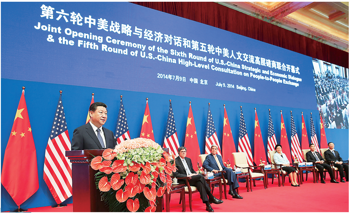
7月9日，习近平在第六轮中美战略与经济对话和第五轮中美人文交流高层磋商联合开幕式上致辞。

35年来，中美关系虽然历经风雨，但总体是向前的，得到了历史性发展。历史和现实都表明，中美两国合则两利，斗则俱伤。中美合作可以办成有利于两国和世界的大事，中美对抗对两国和世界肯定是灾难。