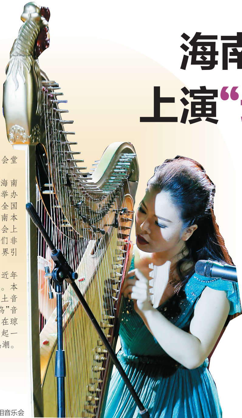
箏篪弹唱《阳关三叠》首次亮相音乐会

而在其背后，是海南近年来民族音乐发展的缩影。本来就底蕴深厚的海南本土音乐和来自全国各地的“候鸟”音乐人相互碰撞、交流，在琼州大地，渐渐掀起一股民族音乐的热潮。