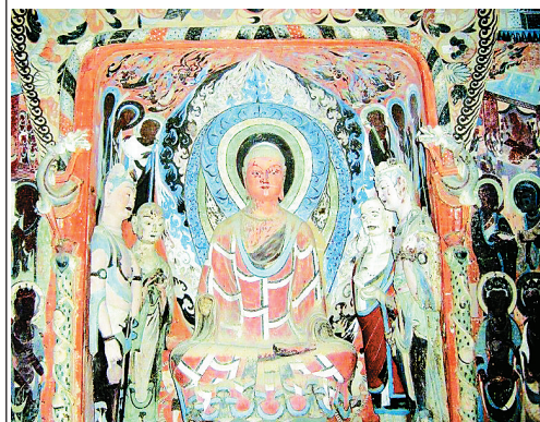
莫高窟壁画将实现数字化保护

点评：世界文化遗产的保护与利用始终是一个矛盾体，国内国际为此都做了很多尝试。敦煌莫高窟的做法颇有新意。首先是缓解了莫高窟的接待压力。采用预约模式，可以有效控制参观人数，对文物起到保护作用；其次在参观之前需接受“数字教育”，观看电影了解莫高窟的历史文化知识，不仅可以让游客更好地理解敦煌文化的壮美，而且也丰富了游览形式和内容，尤其是在敦煌壁画逐年衰败的时候，这一做法也有助于保护。