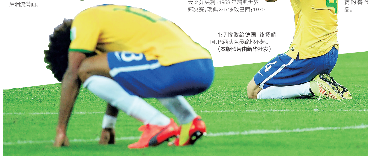
1:7惨败给德国,终场哨响,巴西队员跪地不起。(本版照片由新华社发)