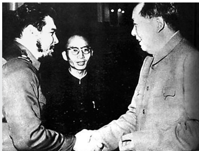
毛泽东1960年11月19日会见了古巴革命政府经济代表团，和埃内斯托·切·格瓦拉亲切握手。