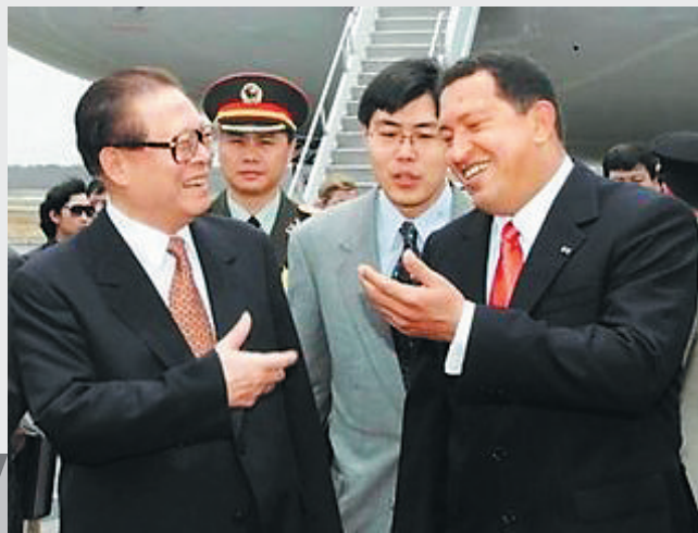
2001年4月15日，江泽民抵达委内瑞拉，查韦斯到机场迎接。