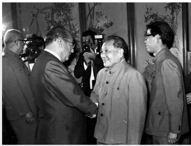
1984年5月29日，邓小平在北京人民大会堂会见巴西总统菲格雷多。